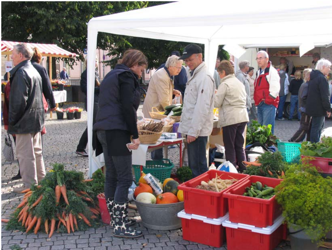
Så här kan det se ut under "landsbygden på stan" på torget i Köping. Många är de varor som byter ägare den här dagen.