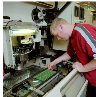
Företaget Hammet står för en del av tillväxten i Hammarstrand, Jämtland. De tillverkar kvalificerade kretskort och sysselsätter 22 personer i byn Pålgård.

Exempel på möjliga samarbetspartner är Nutek, ITPS, Jordbruksverket, AMS, ALI, relevanta myndigheter inom utbildningsområdet.