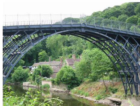
Mycket av den gles- och landsbygdsproblematik som finns i Sverige liknar den i England och Skottland.

Planer finns även på att göra ett studiebesök i något annat land med liknande problematik som Sverige. Dessutom kommer utvecklingsseminariernas målgrupp att särskilt uppmuntras att åka till det nordiska landsbygdsforum som hålls i Vasa, Finland, 2006.