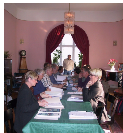
Olika partnerskap fungerar väldigt olika. Här Leader+ Sommenbygd i sammanträde.