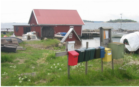
Viss postservice finns på Sladö i Västerviks skärgård trots endast fem bofasta på ön.